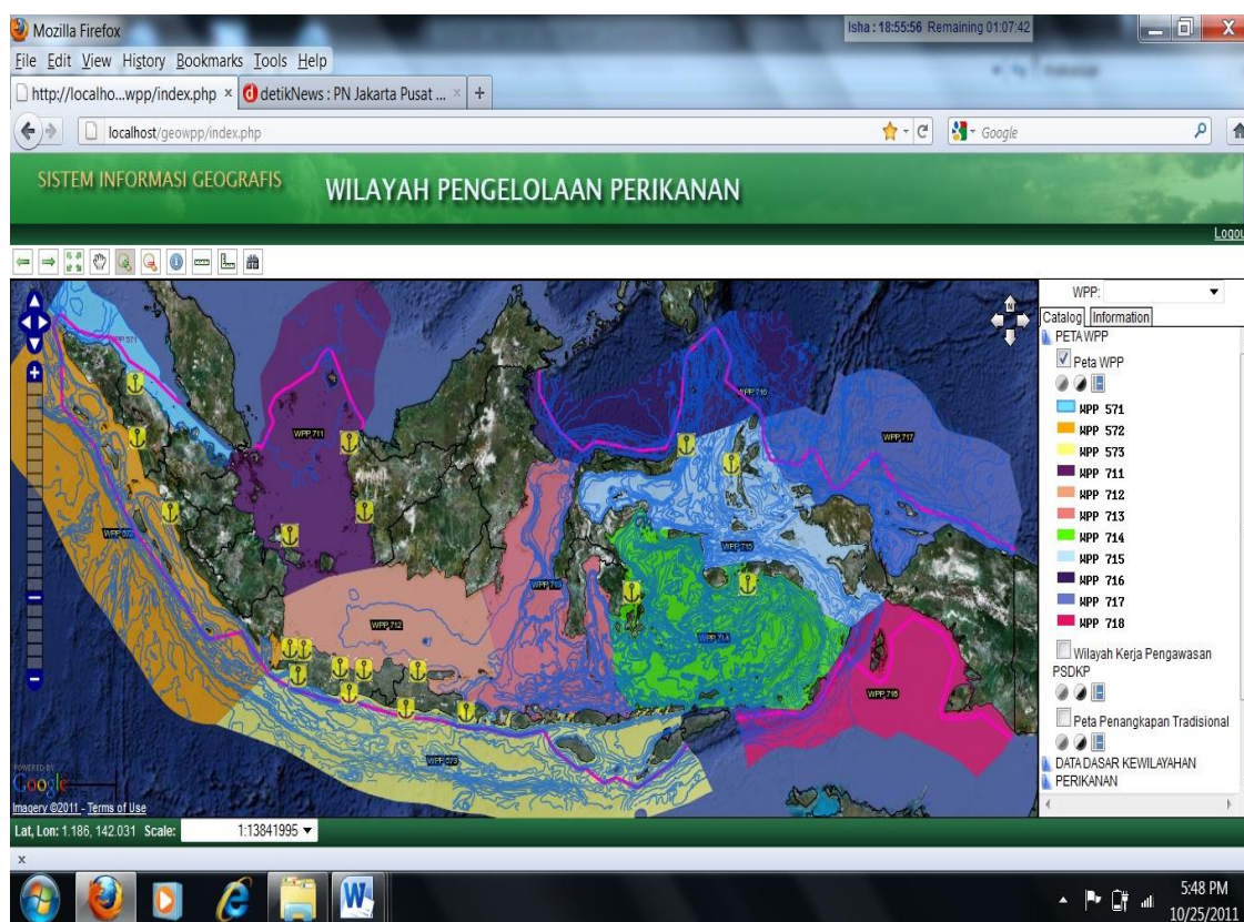
Gambar 1. Tampilan antarmuka (Interface) WebGIS WPP